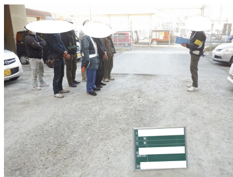
安全教育・KYによる注意喚起状況